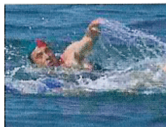
Planche de Sauvetage

Les sauveteurs partent de la plage et doivent nager, contourner les bouées correspondant à l'épreuve et revenir sur la plage pour franchir la ligne d'arrivée.